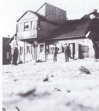
1932 m. Žiežmariai.

Tarpukariu aikštės viduryje stovėjo visa eilė pastatų,