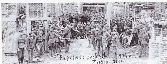
1921 m. Kapeliono paskaita.

procesiją, iš dabartinės Kauno gatvės įeinančią į aikštę. Vaizdas sunkiai atpažįstamas, nes nėra dabartinės bažnyčios. Tačiau bažnyčia jau buvo pradėta statyti; jos statybos sustojo 1915 m., užėjus vokiečiams. Nuotraukoje matosi statybvietėje išskeltos aukštos kartys. Jei nebūtų šventoriaus tvoros ir medžių, mes jau matytume antroje nuotraukoje (iš to paties archyvo) jamžintą vaizdą - Lietuvos 3-ojo pėstininkų pulko kariai kapeliono (pulko kunigo) paskaita tarp pradėtų statyti Žiežmarių bažnyčios sienų. Tai 1921 m. nuotrauka. Tuo metu senosios medinės bažnyčios vietoje jau buvo išlieti pamatai, pastatytas vieno metro aukščio akmeninis cokolis ir dviejų metrų aukščio sienos. Švari aplinka liudija, kad darbai yra jau seniai sustoję.