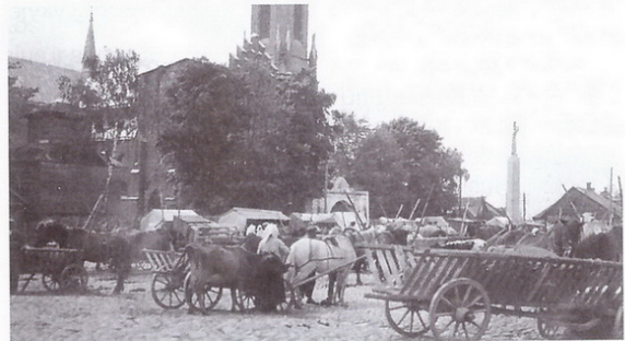
Turgadienio diena Žiežmariuose.

Tokią bažnyčią mes matome XX a. 4 dešimtmetyje da-