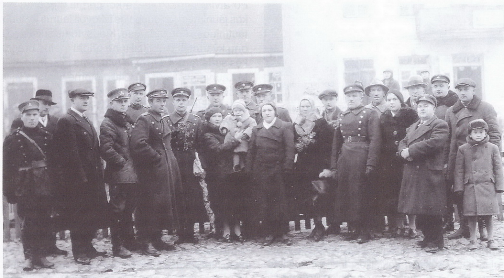
Žiežmariečių nuotrauka atminčiai aikštės centre prie Laisvės paminklo XX a. 4 deš.