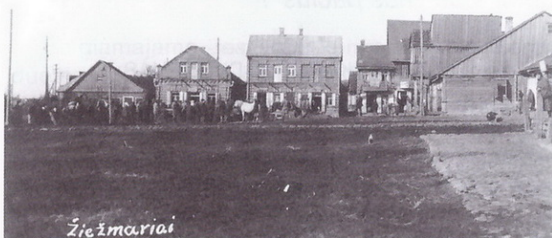
Žiežmariai (penkta nuotrauka).

nekokį įspūdį: „Miestelio centre stovi mūrinė, aukšta, vienu bokštu bažnyčia, kurią gali matyti iš tolo. Ji tebeslegia visą miestelį“ – rašė jis savo užrašuose, kartu su kitais jo darbais, paskelbtuose 1971 m. Prie to norisi pridėti dar keletą sakinių iš minėto rašytojo atsiminimų apie to meto Žiežmarius – beje, ir rajono centrą: „Viduriu gatvės kriuksėdamas ir neskubėdamas bėga stambus, pasišiaušęs paršas. Stabtelėjo ties finansų skyriumi, bet pagalvojęs paspaudė toliau ir pasuko į Kultūros-švietimo skyriaus kiemą. Gatvėse išklijuoti skelbimai „Mažojo Muko istorija“ 8 val. vakaro. Prie kiekvienų namukų prikabintos geležinės blėkutės su įrašu: „Į gaisrą ateik su brūsoku“, ar kaip ten kitaip“.