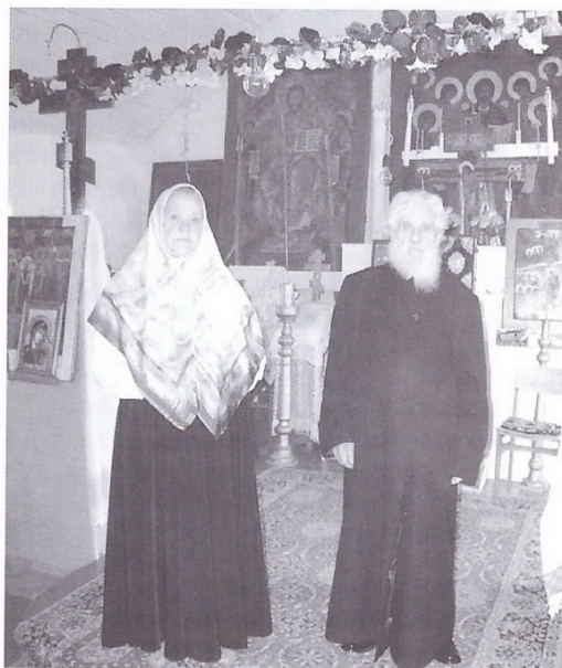
Mūro Strėvininkų rusai sentikiai po Žolines atleidų. 2005 m. rugspjūčio 28 d. (R. Gustaičio nuotr.).

Sentikių praeities tyrimas tęsiamas toliau.