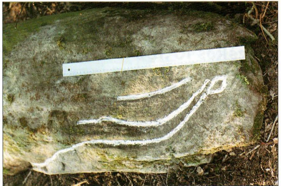
Ekspedicijos metu aptiktas akmuo su iškalto gyvates atvaizu

9. Žaslių geležies amžiaus (Žaslių mst.) gyvenvietė yra šiaurės rytiniame Limino ežero krante, Limino ir Statkūniškio ežerus jungiančio kanalo dešiniajame krante, 310 m į rytus nuo Žaslių-Jonavos kelio, gyventojų sodybi-