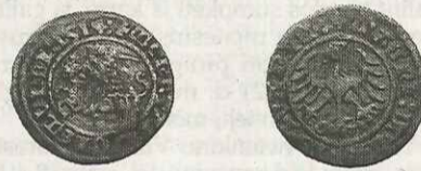
Moneta. Pusgražis. Žygimantas Augustas. Lietuvos Didžioji Kunigaikštystė. 1514 m. (aversas ir reversas). Kaišiadorių muziejus.

valstybė turi savitą monetų sistemą, pagrįstą konkrečiu piniginiu vienetu – euru, rubliu, doleriu, marke, franku, krona, zlotu ir kt.