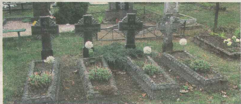
Lietuvos Nepriklausomybės kovų savonorių kapai (1919–1923) Žaslių kapinėse, 2015 m.