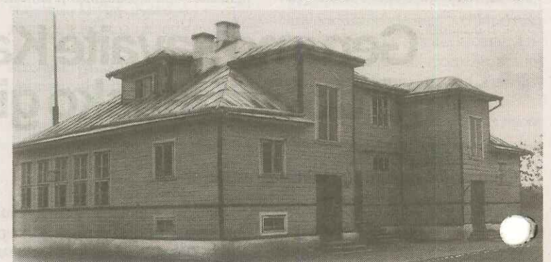
Senoji Rumšiškių mokykla, kuri, keliantis miesteliui (1958–1959 m.), perkelta į Mičiūnus (Nemaitonių sen.).

1988 m. lapkričio 13 d. prie Kaišiadorių kultūros namų iškilmingai pakelta Lietuvos Trispalvė, kurią jočiūnietis