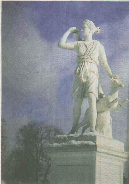
Deivės Dianos statula Švėkšnos dvaro parke