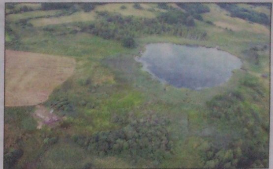
Briuniaus ežero apylinkės ir Bajorų kapinyno kasinėjimo vieta iš paukščio skrydžio (Kietaviškių sen., Elektrėnų sav.).