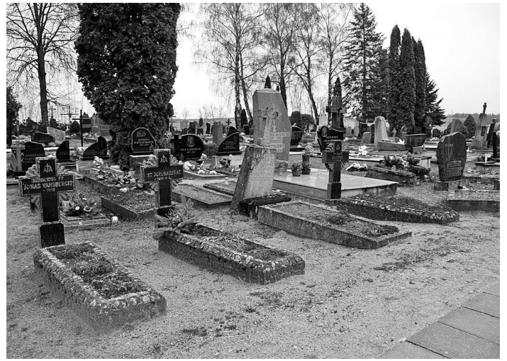
Lietuvos nepriklausomybės kovų savanorių kapai Žiezmariai kapinėse. 2014 m. V. Budvyčio nuotr.

Kovų su boļševikais ties Žasliais metu žuvo 4, sužeista 40 ir dingo be žinios 20 kareivių. Balandžio 10 d. Žiezmariuose