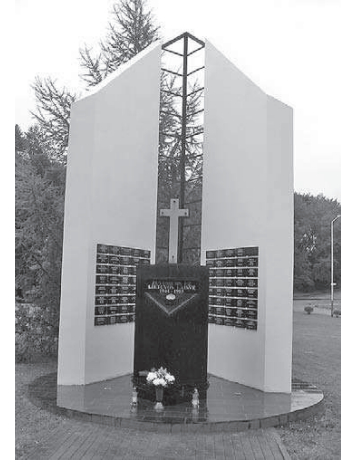
Paminklas Didžiosios Kovos apygardos partizanams Elektrėnuose. 2014 m.

Didžiosios Kovos riktinė 1944 m. vasarą ir rudenį veikė Trakų aps. Žaslių, Kaišiadorių, Žiezmarų, Vievio vls. ir Ukmergės aps. Musninku, Gelvonų vls. miškuose. Partizanų junginio galia buvo partizanai-slapukai, išsklaidyti nedidelėmis