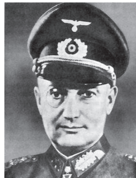
Gen. feldmaršalas Walteris Modelis (1891-1945)