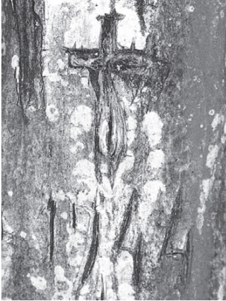
Būdos miško (Palomenės sen.) medis su pažymėta vokiečių karių palaidojimo vieta 1944 metais (ilustracija iš knygos: Malinauskas V., Lukoševičius O. Kaišiadorys: gamtos ir kultūros paveldas. Vilnius, 2001.)