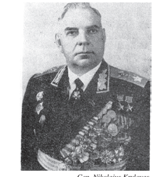
Gen. Nikolajus Krylovas