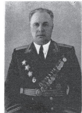
Gen. Stepanas Gladyševs

dalys užėmė Žaslių miestelį. Liepos 14 diena 5-osios armijos pirmieji būriai užėmė ir Žiezmarius, kuriuos vokiečiai traukdami pasėdė.