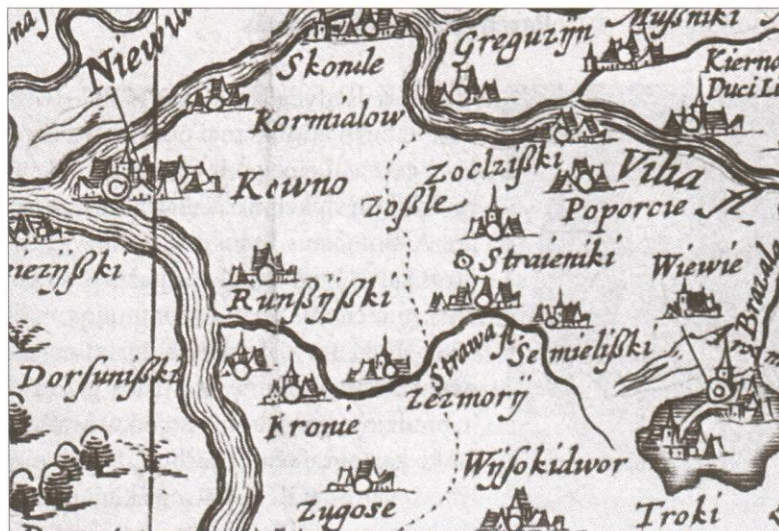
Dabartinio Kaišiadorių rajono teritorija. 1613 m. LDK žemėlapių fragmentas (LMA Vrublevskių bibliotekos Retų spaudinių skyrius. K-845).