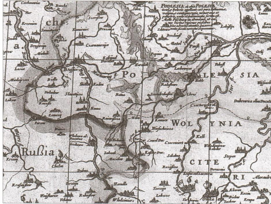
Dveju valstybės sienų žymėjimas (žvaigždutės ir skritulėliai). Iš: Lietuva žemėlapiuose / Sud. A. Bieliūnienė, B. Kulnytė, R. Subatniekienė. Vilnius, LNM, 2002.

kinai, punktyrine linija su skritulėliais. Tai, be abejo, yra savotiška politinė demonstracija prieš Liublino unijos sutartį, pagal kurią nuo Lietuvos buvo atplėštos Ukrainos žemės ir prijungtos prie Lenkijos. Be to, žemėlapyje labai stropiai vaizduojamos plačios Radvilų giminės sodybos, norint pabrėžti, kad ši giminė yra viena garsiausių Lietuvos Didžiojoje Kunigaikštystėje.