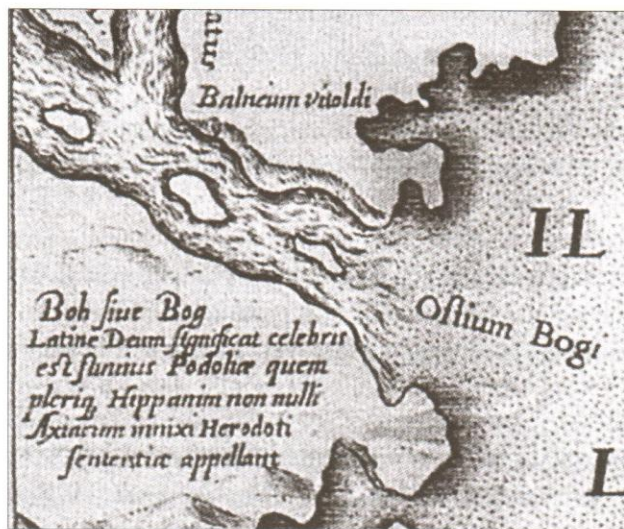
Vytauto maudyklės/pirtys. 1613 m. LDK žemėlapių fragmentas. Iš: Lietuva žemėlapiuose / Sud. A. Biečiūnienė, B. Kulnytė, R. Subatniekienė. Vilnius, LNM, 2002.

Istoriografijoje yra tradicija žodį „maudyklė“ arba „pirtis“ (priklauso nuo lotyniško žodžio balneum vertimo) sieti su buvusiomis LDK muitinėmis. Nes žodis „pirtis“ šiuo atveju gali būti traktuotinas ne tik kaip malonumas , bet ir kaip iškaršimas . Taigi šią žemėlapių žinutę galima pagrįstai vertinti kaip žemėlapių sudarinėtojų siekį pabrėžti ekonominę bei politinę aptariamą teritoriją (Dnepro upės ir jos deltos) įvaidymą Vytauto Didžiojo laikais.