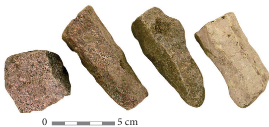
1 pav. Pakertų (Kaišiadorių r.) radimvietės medžiaga prie buvusio ežero.

Fig. 1. The material from the Pakertai (Kaišiadorys district) find spot near a former lake.