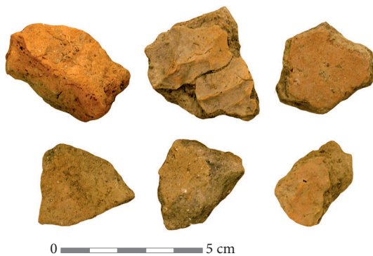
2 pav. Grublėta keramika iš Gluosnininkų / Navininkų spėjamos gyvenvietės (Alytaus r.).

Fig. 1. The material from the Pakertai (Kaišiadorys district) find spot near a former lake.