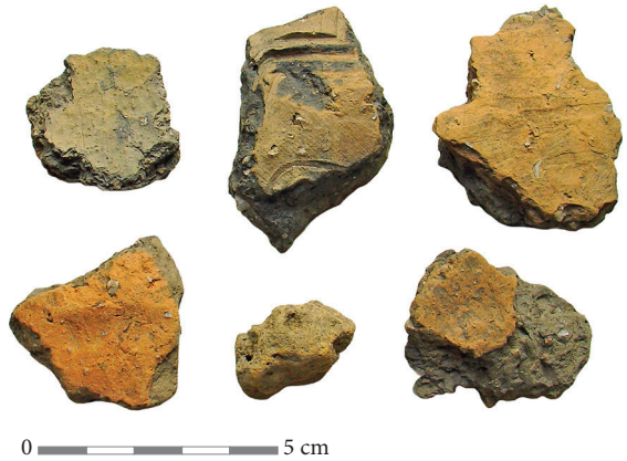
3 pav. Pėdiškių (Lazdijų r.) senovės gyvenvietės keramika.

Fig. 4. Vošiškės village (Prienai district) cemetery with cast and hand-forged metal grave markers.